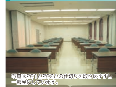
写真は201と202との仕切りを取りはずし一部屋にしています。

201と202は仕切りをはずせば定員40名～最大60名の大会議室として使用が可能となります。研修、会議の会場としてご利用ください。